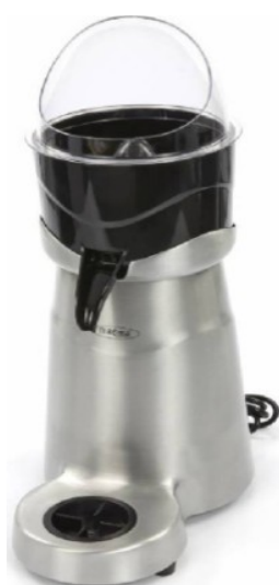
MODELO CJ32LH XL