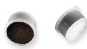
MODELOS CA-FOX-P / CA-MYCAPS