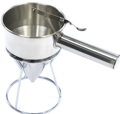
MODELO DISPENSER 1.3