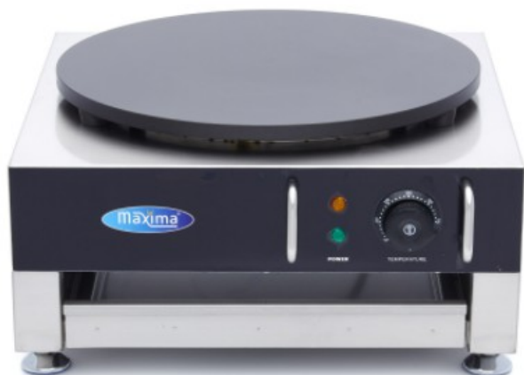
MODELO CREPE SINGLE