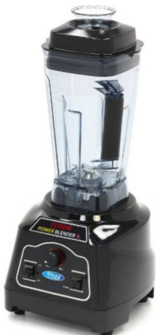
MODELO BPOWER XL