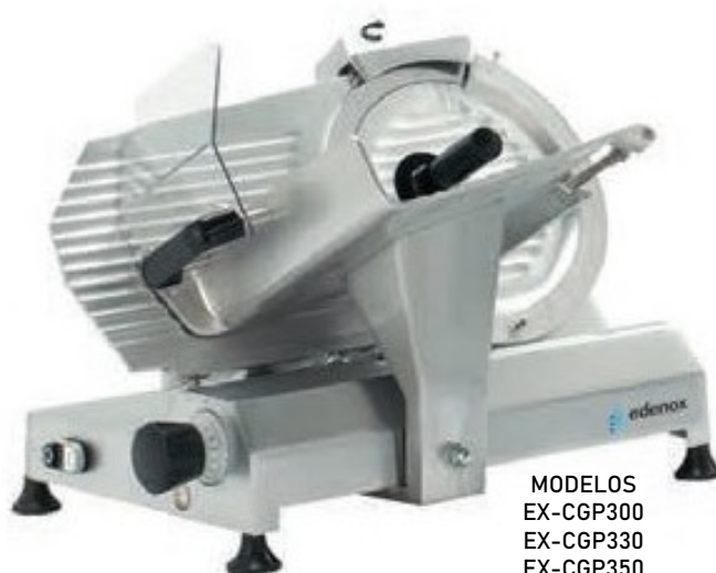
MODELOS EX-CGP300 EX-CGP330 EX-CGP350