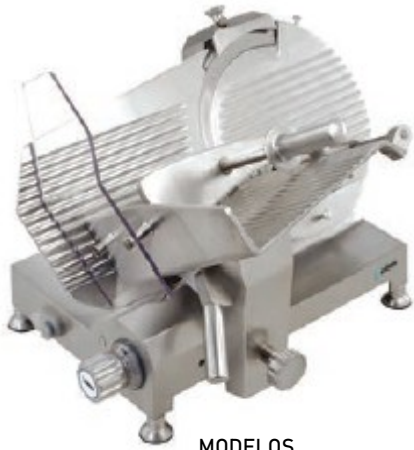
MODELOS ASG220T - ASG250T - ASG275T - ASG300T