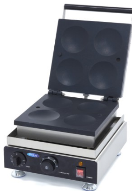
MODELO PANCAKE 4