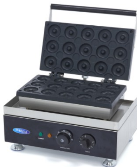
MODELO MINI DONUT 15