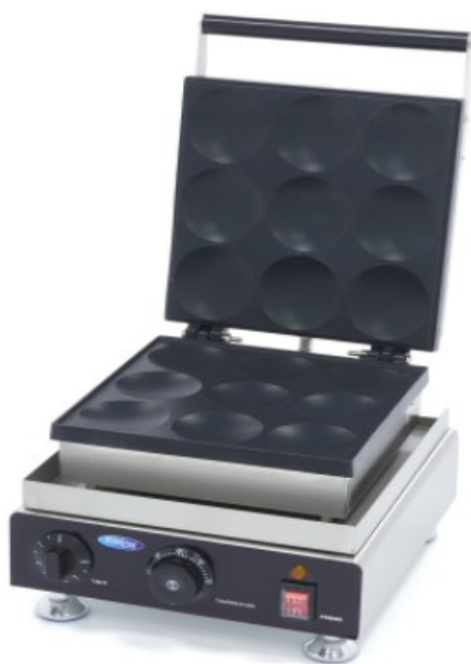
MODELO PANCAKE 9