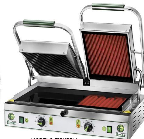
MODELO FIPV55LL MODELO FIPV55LR