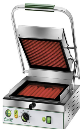
MODELO FIPV27LL MODELO FIPV27LR