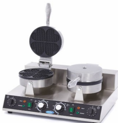
MODELO HEARTS DOUBLE