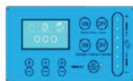
PAINEL DE COMANDO DIGITAL