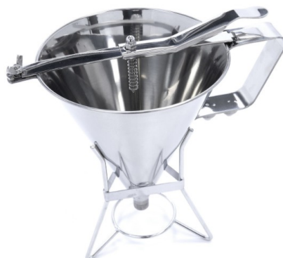
MODELO DISPENSER DELUXE 1.6