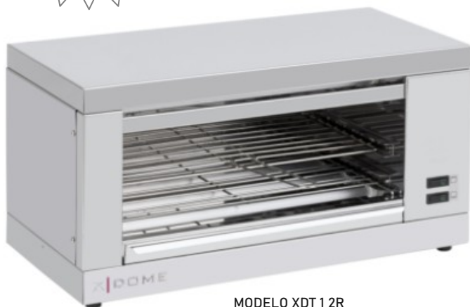
MODELO XDT 1 2R