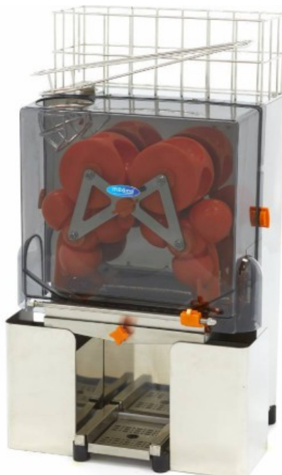
MODELO AUT. MAJ26X