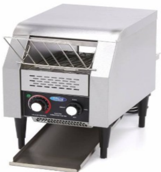
MODELO MTT-150 MODELO MTT-300 MODELO MTT-450