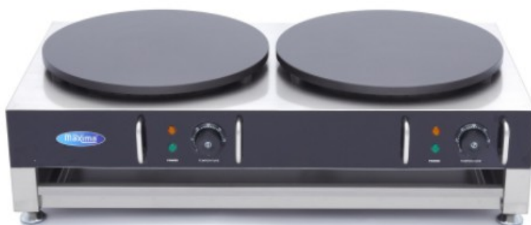
MODELO CREPE DOUBLE