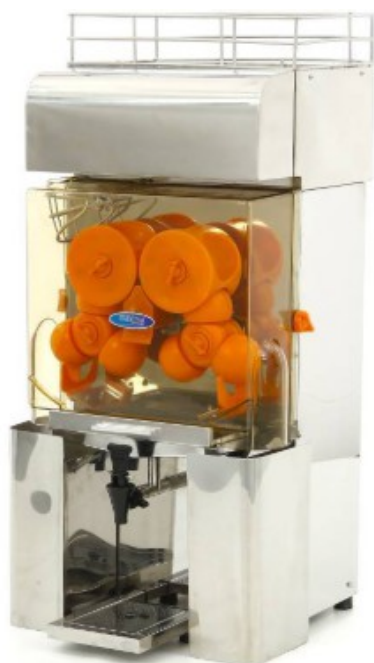
MODELO AUT. SS MAJ45