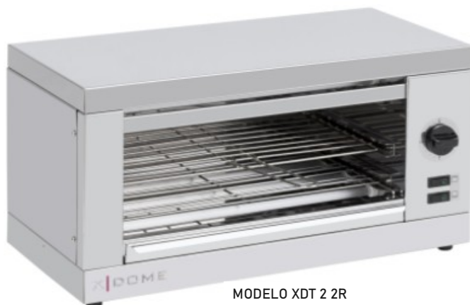
MODELO XDT 2 2R