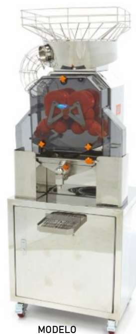
MODELO AUT. MAJ80X