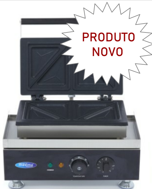
MODELO SANDWICH PANINI