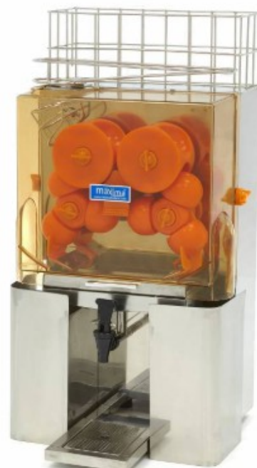
MODELO SS MAJ25