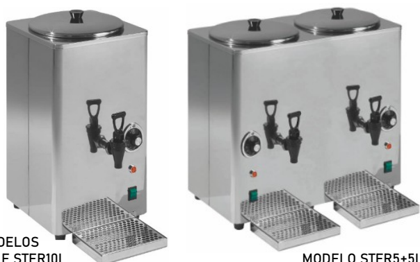
MODELOS STER5L E STER10L