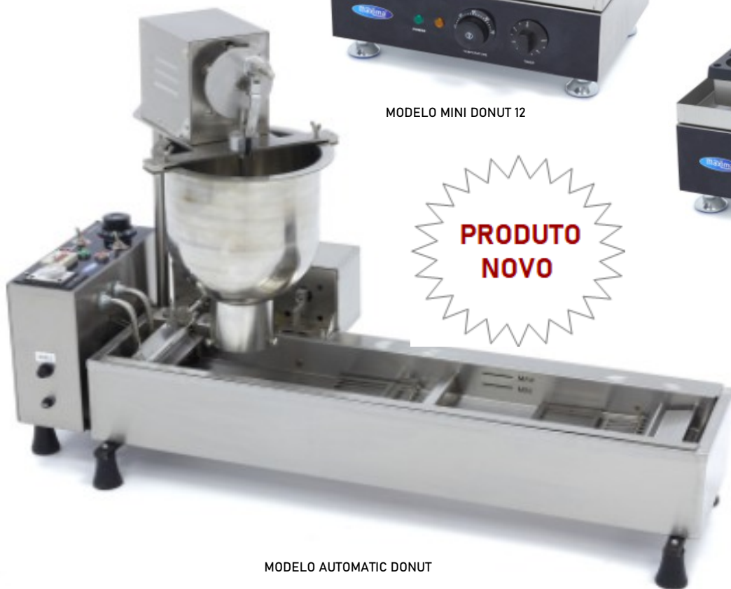
MODELO AUTOMATIC DONUT