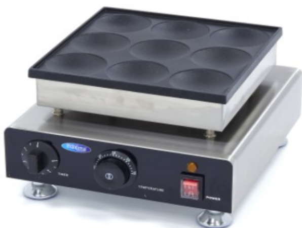
MODELO PANCAKE PLATE 9