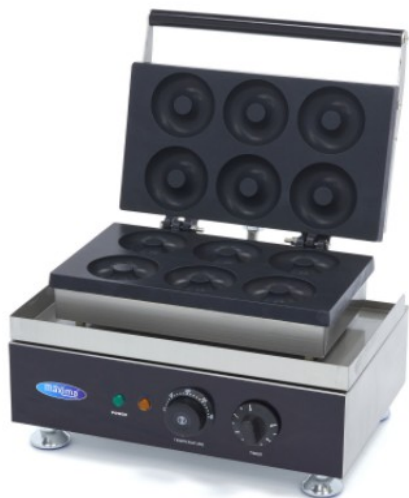
MODELO MINI DONUT 6