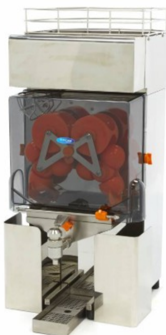
MODELO AUT. SS MAJ50X