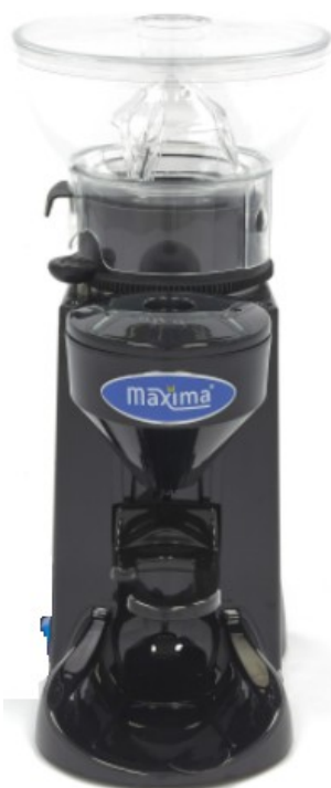
MODELO ELEGANCE 500