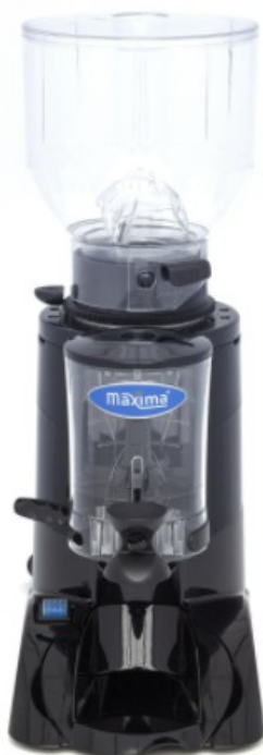
MODELO ELEGANCE 600 MODELO ELEGANCE 600A