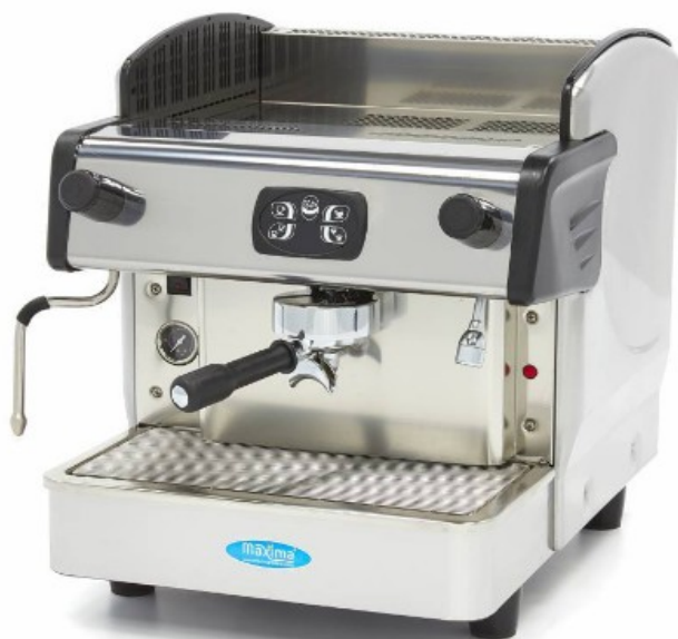
MODELO GRUPPO 1