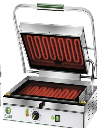
MODELO FIPV40LL MODELO FIPV40LR