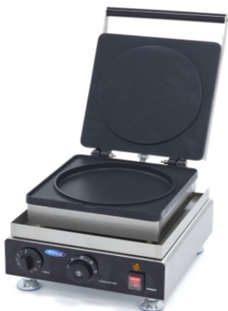
MODELO PANCAKE 1