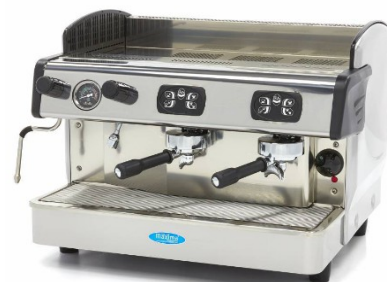
MODELO GRUPPO 2 / GRANDE