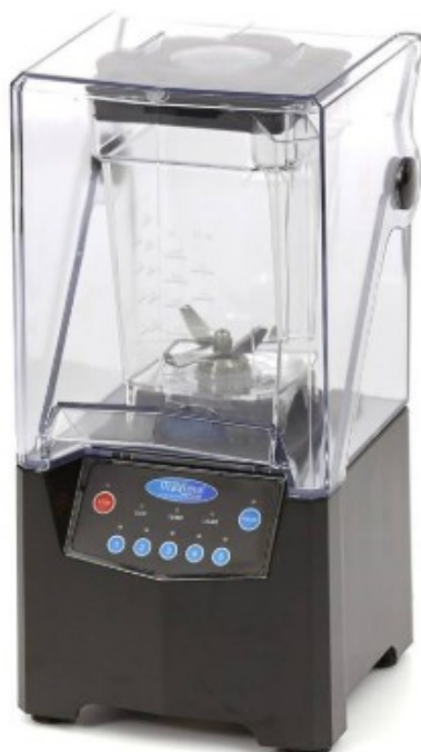
MODELO BMASTER ULT.

IDEAIS PARA TRABALHAR COM GELO JÁ PICADO!