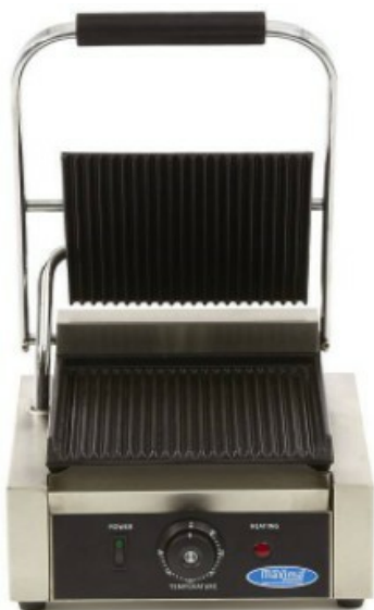
MODELO NERVURADA SINGLE MODELO NERVURADA PANINI