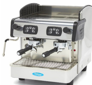
MODELO GRUPPO 2