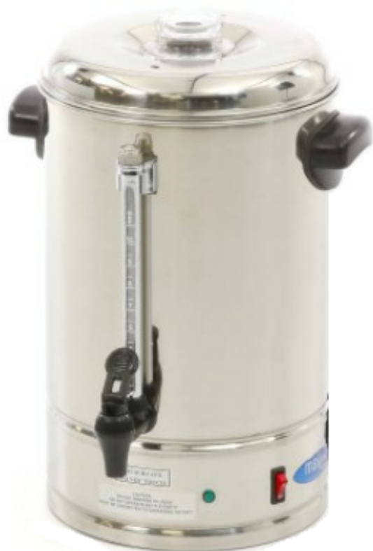
DISPENSADORES DE CAFÉ