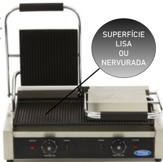
MODELO NERVURADA DOUBLE MODELO LISA DOUBLE