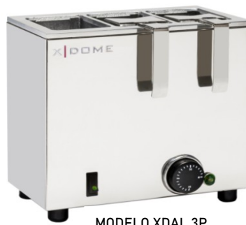
MODELO XDAL 3P