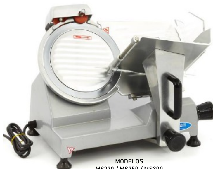
MODELOS MS220 / MS250 / MS300