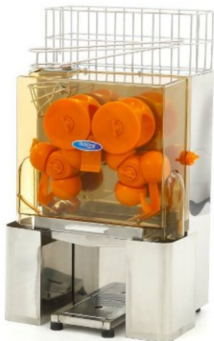
MODELO AUT. MAJ25