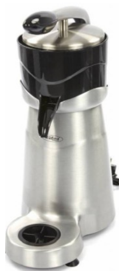
MODELO CJ32LH XL AUTOM.