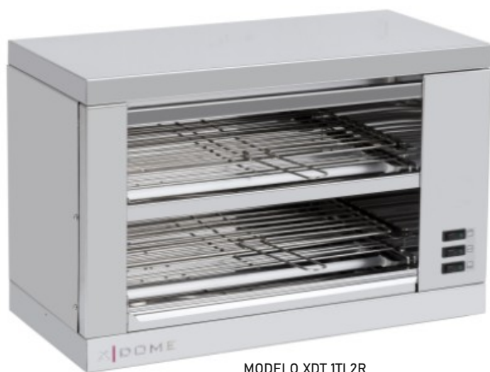
MODELO XDT 1TI 2R