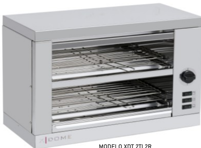
MODELO XDT 2TI 2R