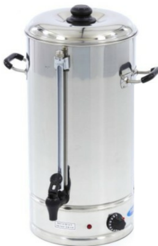
FERVEDORES DE ÁGUA