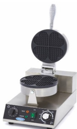
MODELO HEARTS SINGLE