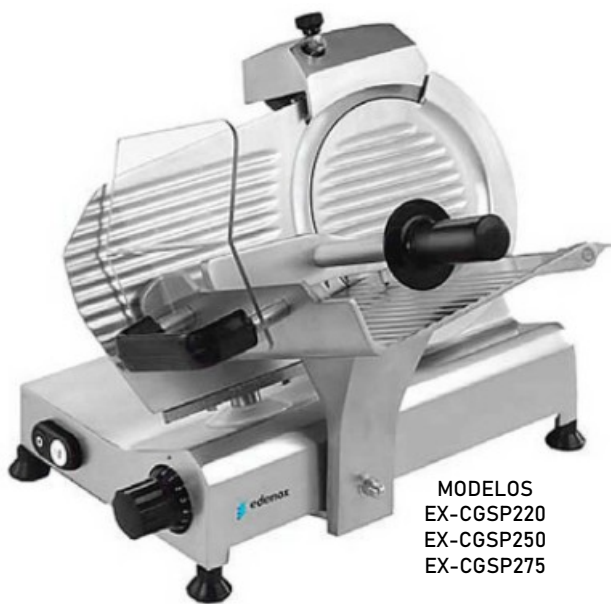
MODELOS EX-CGSP220 EX-CGSP250 EX-CGSP275