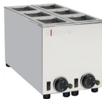
MODELO XDAL 6P