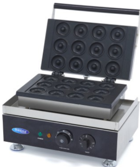
MODELO MINI DONUT 12