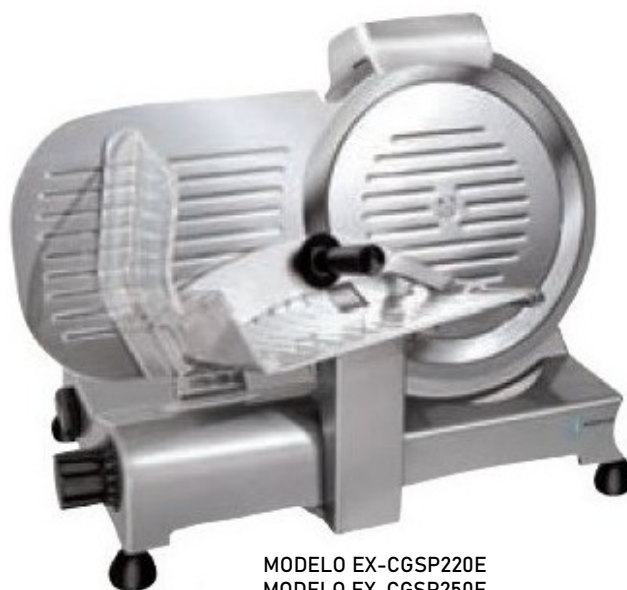
MODELO EX-CGSP220E MODELO EX-CGSP250E