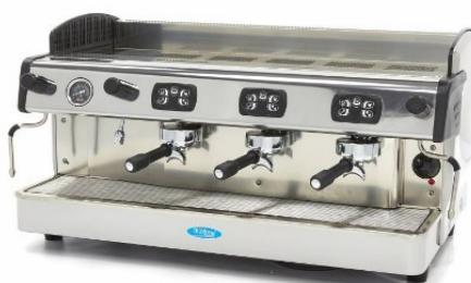
MODELO GRUPPO 3 / GRANDE